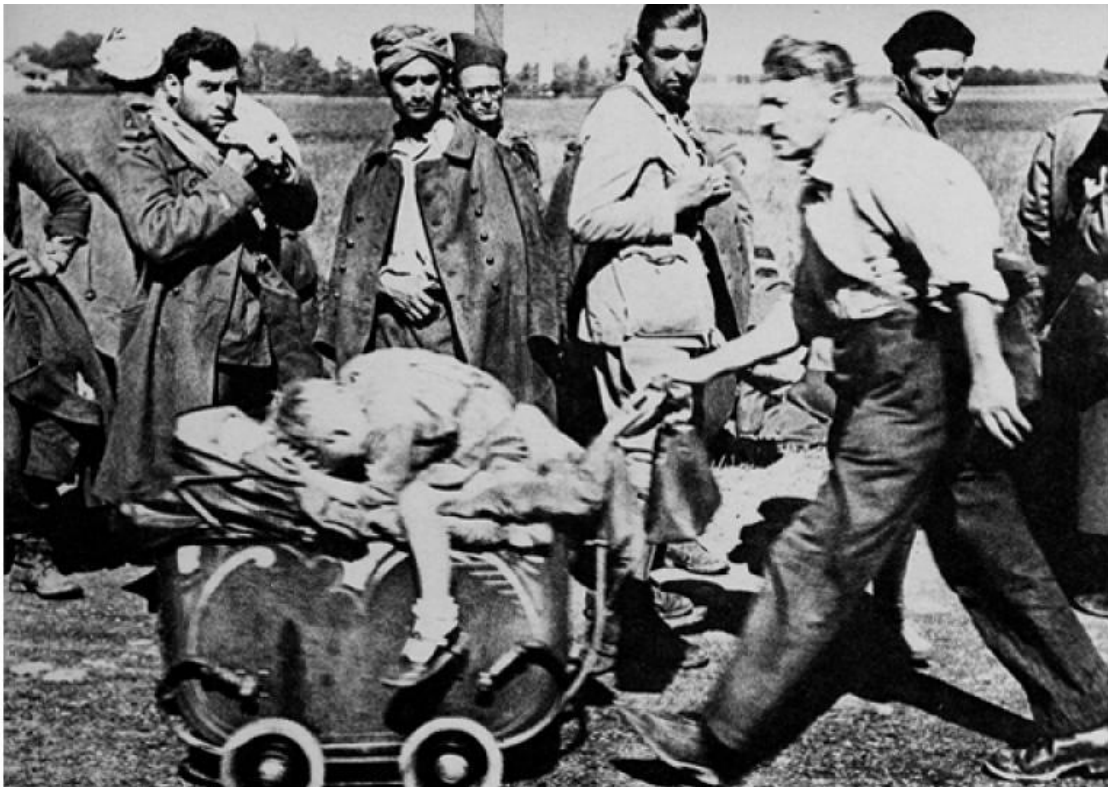
Guerre 1939 – 1945- Invasion de la France – Civils en exode croisant des soldats français prisonniers – Mai Juin 1940.

Non seulement la France est défaite militairement, mais c'est tout un pays qui s'effondre. Huit millions de réfugiés se retrouvent sur les routes. Maires, gendarmes, boulangers, employés, beaucoup fuient vers l'ouest et le sud de la France. La structure politique et sociale s'écroule, les cadres et les repères ne résistent plus, on assiste au chaos d'une société démocratique qu'on pensait très solide.